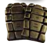
Knäskydd Art.nr 0899 993000

Midjebyxa 295:-/par Knäskydd 0899 993000 85:-/par